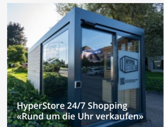
HyperStore 24/7 Shopping «Rund um die Uhr verkaufen»